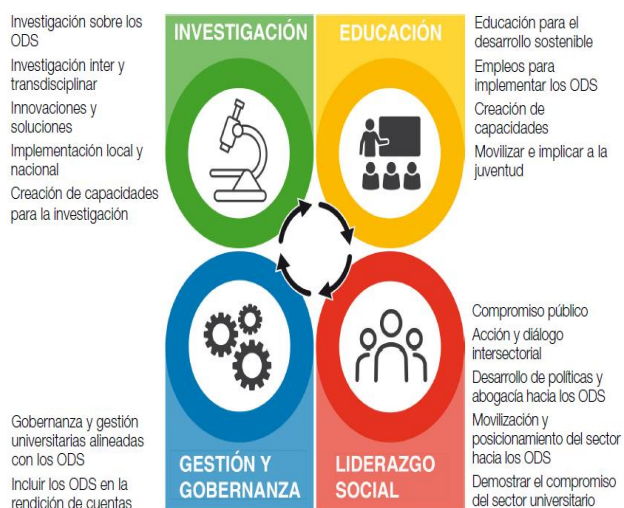
Figura 2 Áreas propias de la Universidad en relación a los ODS